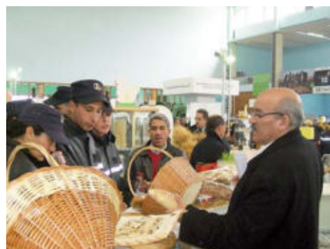
Le directeur général de l'itgc en conversation avec une équipe de la protection civile.