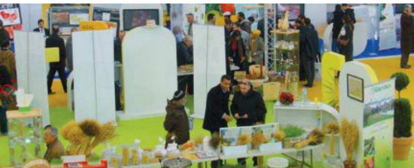
L'espace de l'itgc

L'ITGC a proposé pour réédition les 12 fiches techniques des espèces des grandes cultures, émanant du recueil réalisé en 2006, ainsi que la brochure, bilingue "comment raisonner la fertilisation azotée de vos céréales ?", l'ouvrage sur "la technologie semencière et production des céréales à paille en Algérie" et le dépliant de présentation de l'ITGC en double version arabe et français. Les contenus devaient être remis finalisés, sous format pdf, dans un laps de temps très court, c'est pour cette raison que nous avons choisi les documents déjà élaborés et malgré qu'ils ont été remis dans les temps, seules deux brochures ont été réalisées ; il s'agit de la présentation de l'ITGC et de la fertilisation azotée des céréales (en arabe et français).